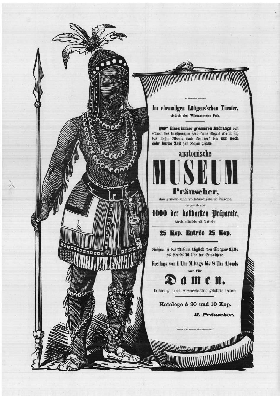
1. att. Preišera anatomiskais muzejs. Plakāts no LU Akadēmiskās bibliotēkas Reto grāmatu un manuskriptu nodaļas