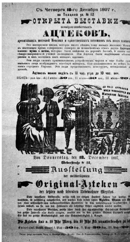
5. att. "Īstie acteki" Rīgā, Audēju ielā 12, 1897. gada decembrī. Fig. 5. "The Real Aztecs" in Riga, 12 Audēju Street, December 1897.

dēļ bija pieejami gandrīz visiem Rīgas sabiedrības slāņiem, tad to nevar teikt par 19. gadsimta vidū Mazajā ģildē bijušajiem Huliju Pastranu vai brāļiem Bunkeriem.