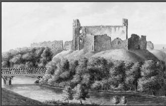
LIVONIJAS PIĻU ATTĒLI NO MARĶĪZA PAULUČI ALBUMA ABBILDUNGEN DER LIVLÄNDISCHEN BURGEN IM ALBUM DES MARQUIS PAULUCCI

Livonijas piļu attēli no marķīza Pauluči albuma / Izdošanai sagatavojusi, tulkojusi un komentējusi Ieva Ose. – Rīga: Latvijas vēstures institūta apgāds, 2008. – 319 lpp.: il.